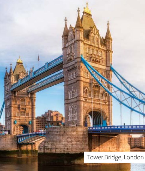
Tower Bridge, London

BORDGUTHABEN IM WERT VON 150 € P.P. INKL!