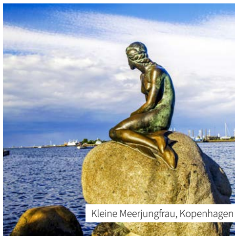
Kleine Meerjungfrau, Kopenhagen

Norwegen ist das Land der Fjorde. Riesige Gletscher formten vor vielen Tausend Jahren diese Unterwassertäler, die sich längst zu salzigen Meeresarmen entwickelt haben. Diese achttägige Kreuzfahrt führt Sie von Kiel über das dänische Kopenhagen tief hinein in den Hardangerfjord und den Gandsfjord. Spektakuläre Wasserfälle und atemberaubende Wanderwege erwarten Sie hier, außerdem tauchen Sie ein in die typisch norwegische Lebensweise! In der UNESCO-Welterbe-Stadt Bergen haben Sie dann genug Zeit, das Erlebte und Gesehene sacken zu lassen – zum Beispiel im historischen Viertel Bryggen mit seinen charmanten Holzhäusern.