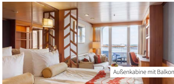
Außenkabine mit Balkon